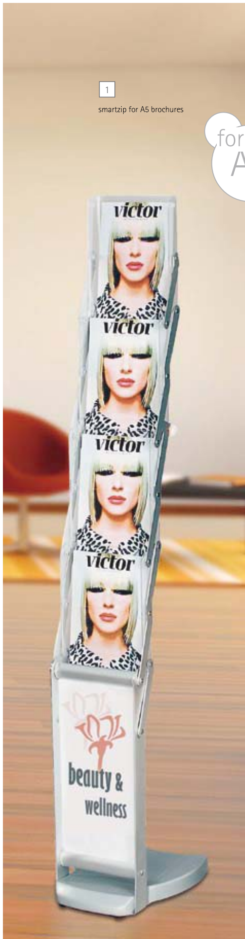
1 smartzip for A5 brochures